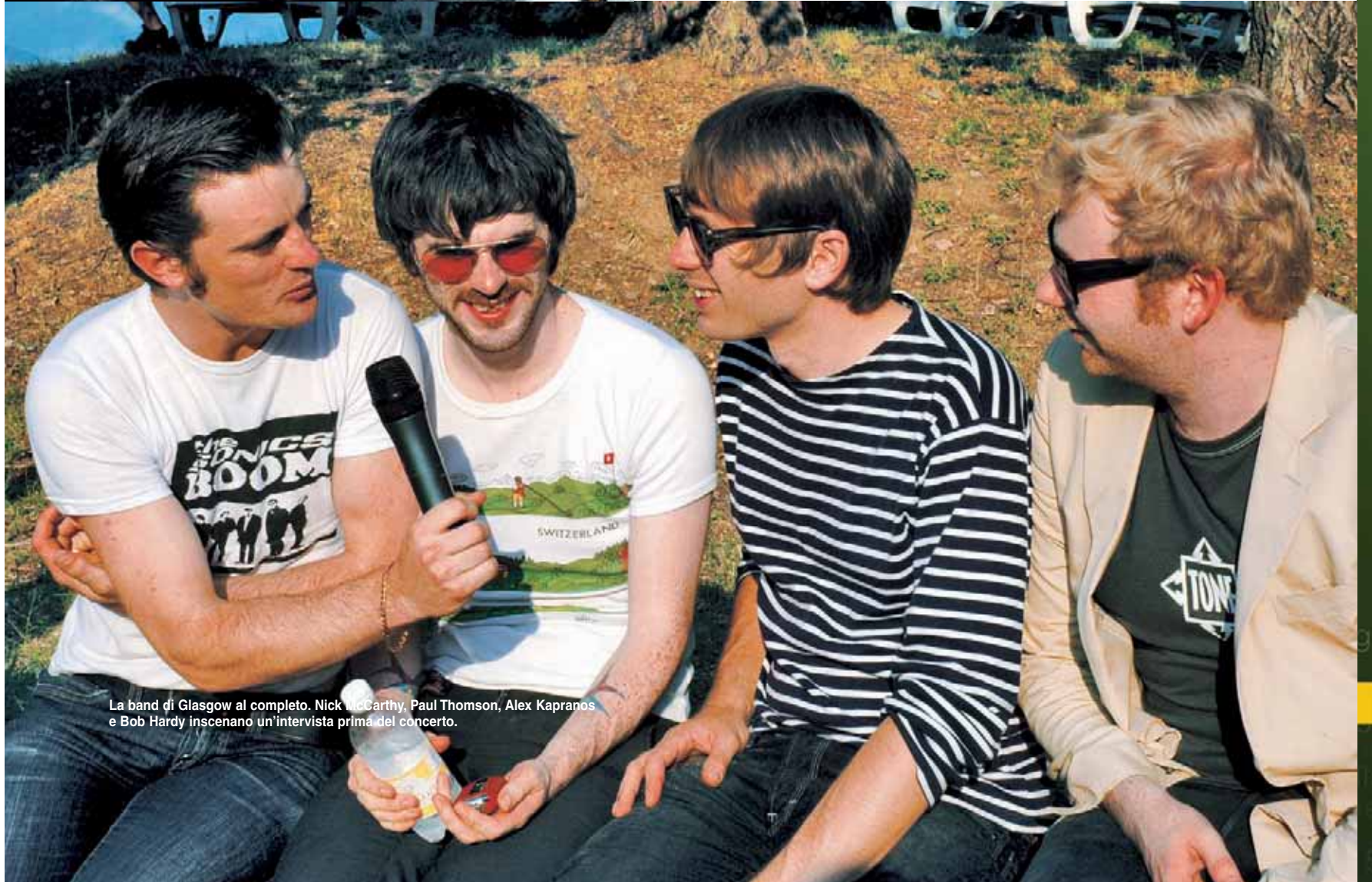
La band di Glasgow al completo. Nick McCarthy, Paul Thomson, Alex Kapranos e Bob Hardy inscenano un'intervista prima del concerto.

È capitato per caso a 18 anni: avevo mollato l'università, dove studiavo geologia, perché non faceva per me. Così mi misi in cerca di lavoro e su un giornale di annunci trovai quello di un ristorante nel nord della Scozia che reclutava personale: mi presero come lavapiatti e col tempo cominciai anche a preparare le verdure e a fare altri lavoretti di bassa cucina. Molti cuochi hanno cominciato così... Rimasi lì più o meno sei mesi. E da quel momento in avanti continuai per periodi brevi in posti diversi, una decina in tutto, anche come sommelier e barista. Trovo che uno staff di cucina funzioni un po' come un gruppo rock: l'intensità dell'ambiente e delle emozioni, la necessità di relazione tra gli individui, il modo in cui devono conciliarsi temperamenti diversi. Le dinamiche di una buona band sono simili a quelle di un buon team da ristorante: persone che lavorano bene insieme e a volte si intendono